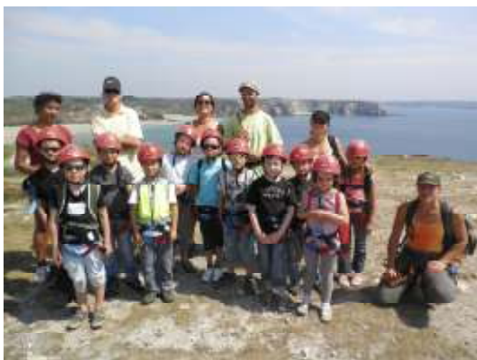
Camaret, les « Loustig » Le jour de la visite du Maire

Le Centre accueille vos enfants (dès leur scolarisation et jusqu'à 12 ans) tous les mercredis et toutes les vacances scolaires .